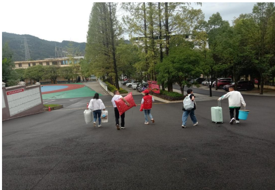
志愿者帮助家长们拿行李

团委的组织安排下，青年志愿者协会组织了4名志愿者前往特殊学校协助迎新活动的展开。