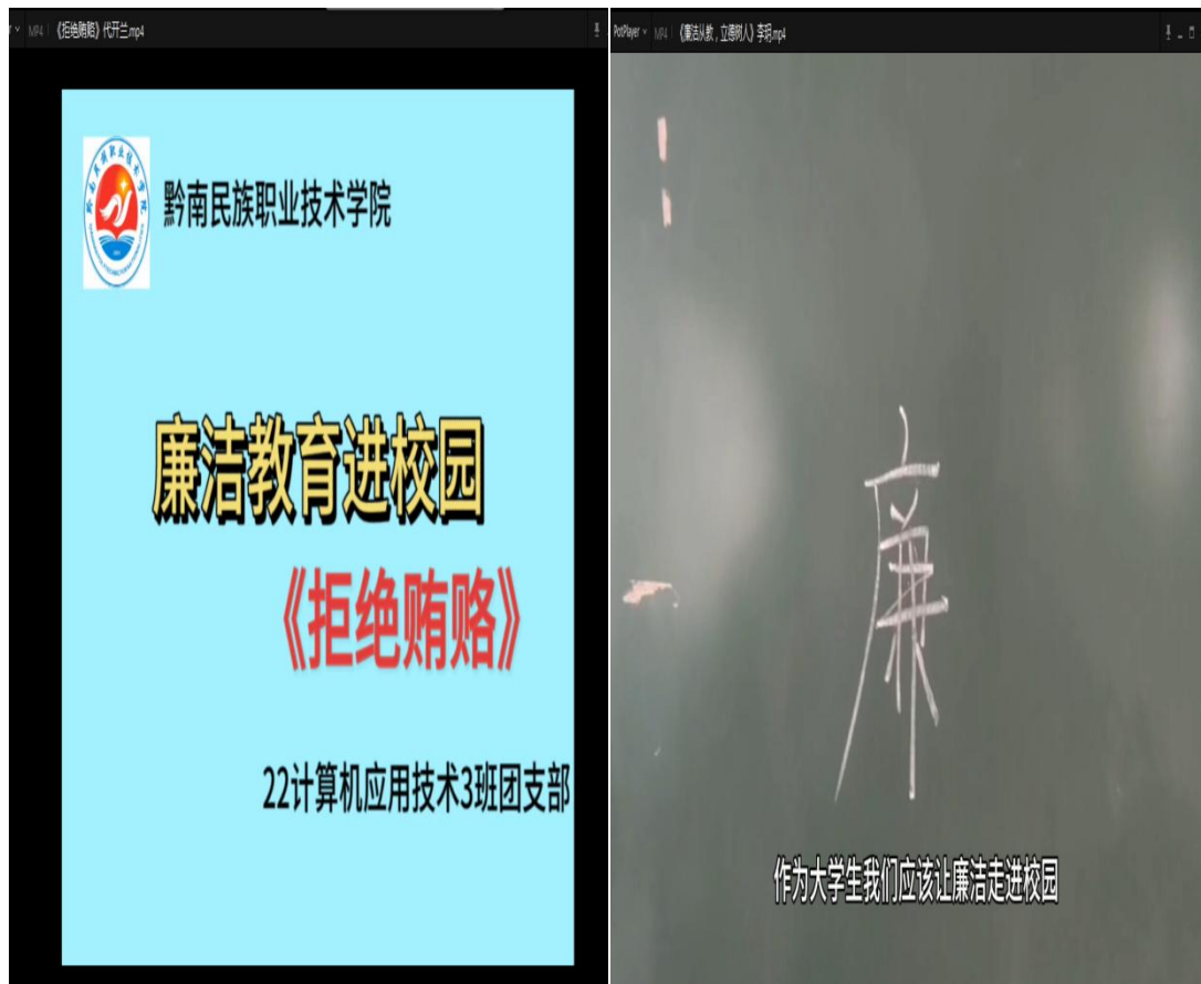
图为学生短视频作品截图