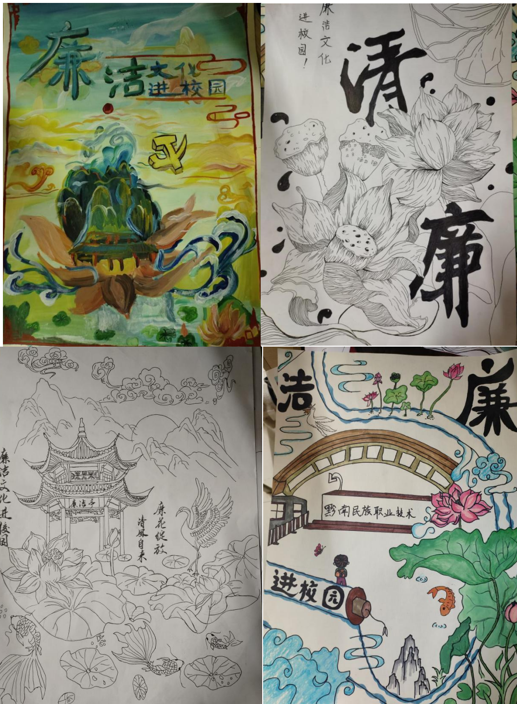
学生作品部分展示